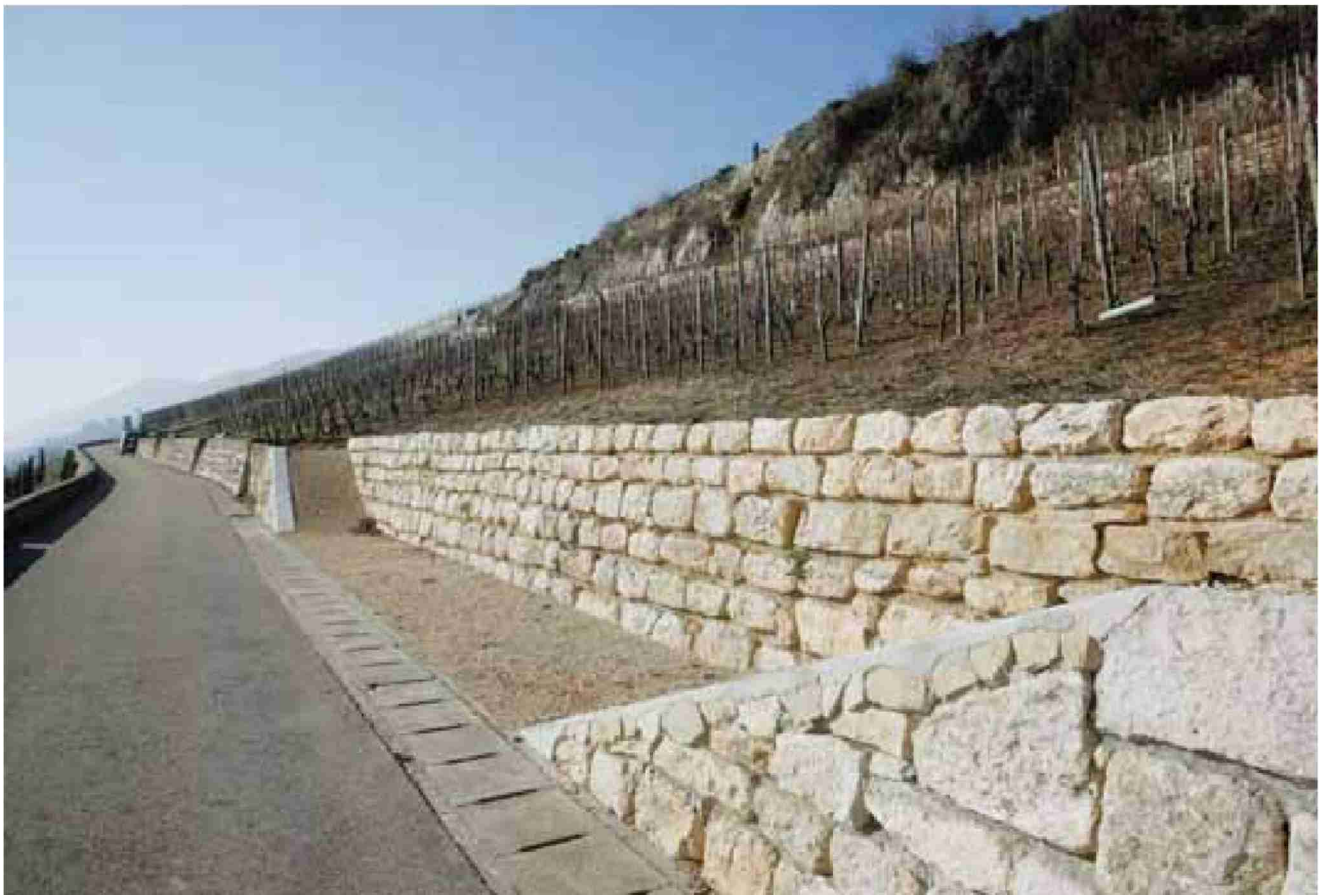
Das ist der neue Mauertyp , der die Mehrkosten verursacht hat. Der Grosse Rat sprach gestern den Kredit.