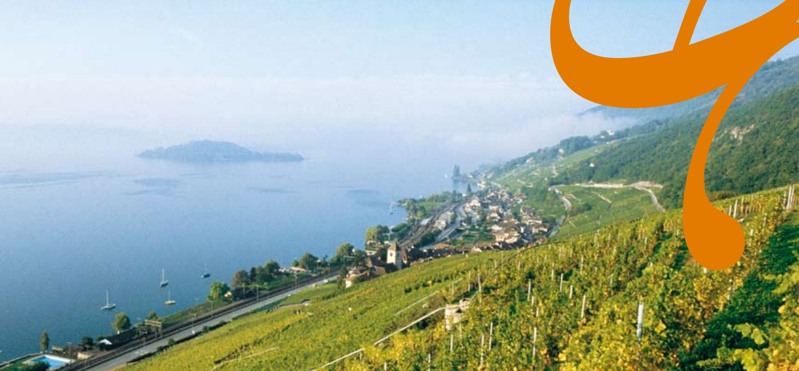
Blick vom Kapf auf Twann