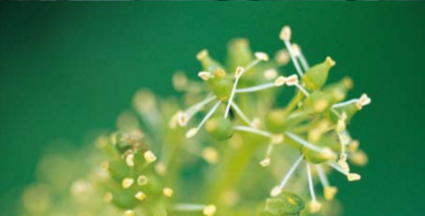
Oben: Pinot Noir Unten: Blühender Sauvignon Blanc